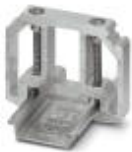
Koncovka, k vytvoření opěry svornic UKH 50 až UKH 240, na nosnou lištu NS 35, se 2 šrouby, šířka: 10 mm, barva: hliník